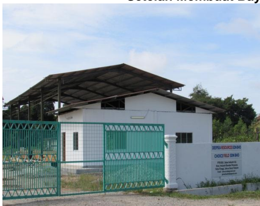
Lokasi: Lot PTB818, Bandar Penawar Fasa 1 Tarikh: 9 Disember 2014