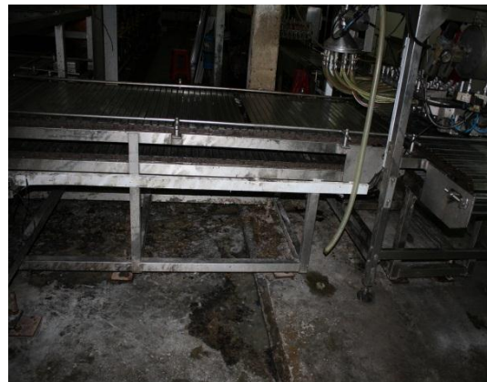
Gambar 1.6 Persekitaran Pemprosesan Kurang Bersih

Lokasi: Kilang Roti Di Muar Tarikh: 2 Disember 2014