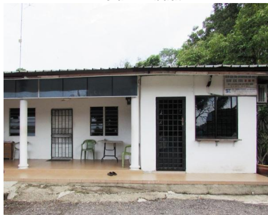
Gambar 2.2 Tanah Telah Diusahakan Dengan Bangunan Pejabat Walaupun Pembayaran Notis 5A Belum Dibuat

Sumber: Jabatan Audit Negara Lokasi: Sg. Sedili Tarikh: 11 Januari 2015