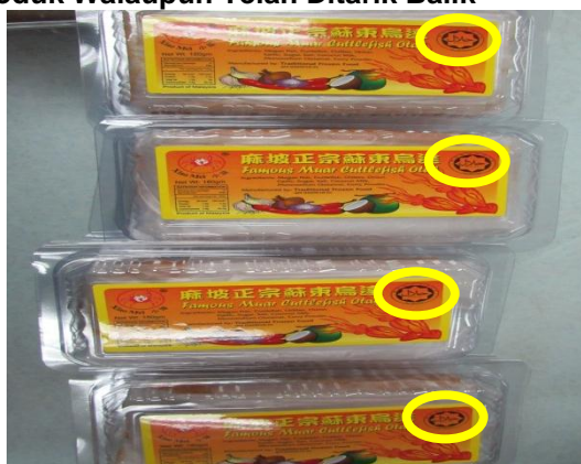
Lokasi: Kilang Makanan Di Muar Tarikh: 11 Februari 2015

1.4.3.3. Berdasarkan maklum balas JAINJ bertarikh 19 Mac 2015, antara faktor pemegang SPH tidak akur terhadap peraturan yang ditetapkan adalah Jawatankuasa Halal Dalaman syarikat tidak berfungsi dengan baik serta tidak terlatih dan hanya diwujudkan sekadar untuk memenuhi kehendak MPPHM 2011 (Semakan Kedua). Pihak JAINJ juga hanya dapat melaksanakan 10% latihan berkaitan halal kepada syarikat kerana mengalami kekangan peruntukan. Bagaimanapun, usaha mempertingkatkan lagi penganjuran latihan dan program akan diteruskan dari semasa ke semasa dengan mewujudkan kerjasama bersama agensi lain yang berkaitan.