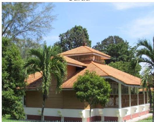
Gambar 2.24 Surau

Lokasi: Tanjung Balau, Kota Tinggi Tarikh: 9 Disember 2014