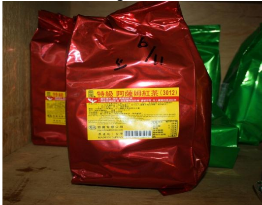
Lokasi: Premis Makanan Di Muar Tarikh: 1 Disember 2014