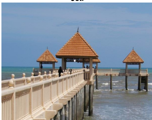
Gambar 2.21 Jeti

Lokasi: Tanjung Balau, Kota Tinggi Tarikh: 9 Disember 2014