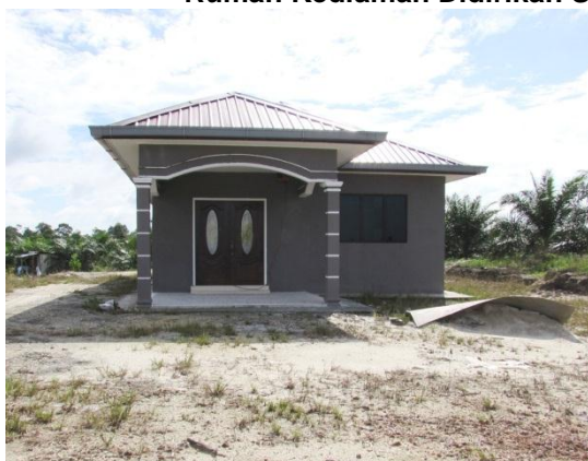
Gambar 2.5 Rumah Kediaman Didirikan Sebelum Kelulusan Pemberimilikan

Lokasi: Desa Baru Nitar, Mersing Tarikh: 13 November 2014