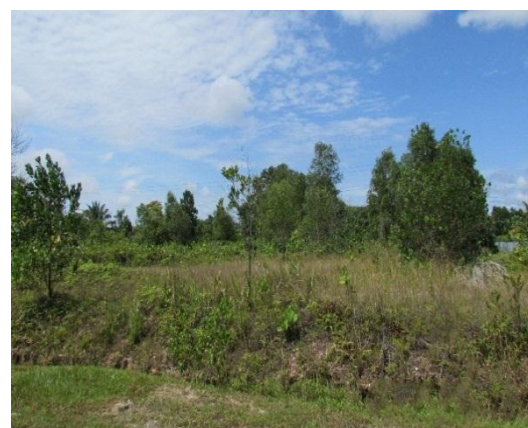
Lokasi: Lot PTB1473, Bandar Penawar Fasa 2 Tarikh: 8 Disember 2014