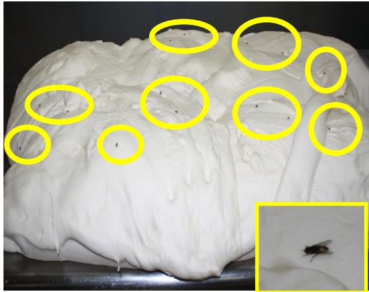
Gambar 1.7 Adunan Roti Dihinggapi Lalat

Lokasi: Kilang Roti Di Pontian Tarikh: 12 November 2014