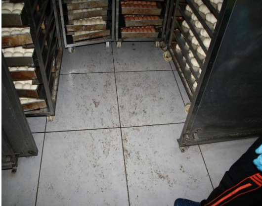
Gambar 1.1 Kebersihan Lantai Kurang Memuaskan Di Tempat Pengeraman Roti

Lokasi: Kilang Roti Di Johor Bahru Tarikh: 11 November 2014