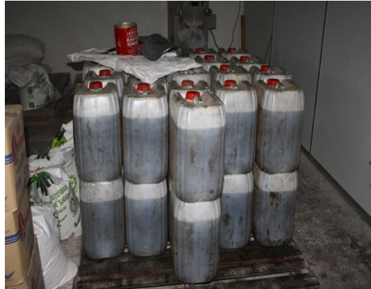
Gambar 1.10 Penggunaan Minyak Masak Terpakai Dalam Pembuatan Biskut

Lokasi: Kilang Makanan Di Batu Pahat Tarikh: 11 November 2014