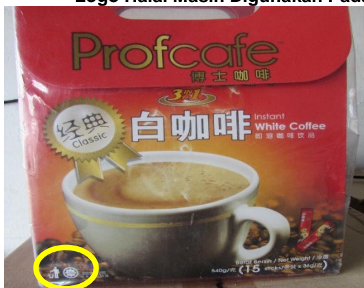
Lokasi: Kilang Makanan Di Johor Bahru Tarikh: 12 Februari 2015