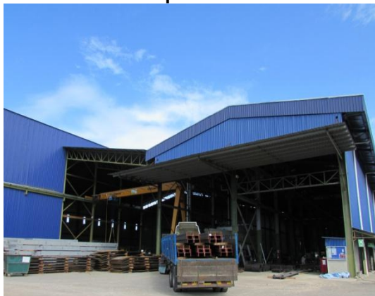
Gambar 2.8 Kilang Yang Beroperasi Di Atas Tanah Kerajaan Negeri Setelah Membuat Bayaran 100% Kepada KEJORA

Lokasi: Lot PTB811, Bandar Penawar Fasa 1 Tarikh: 9 Disember 2014