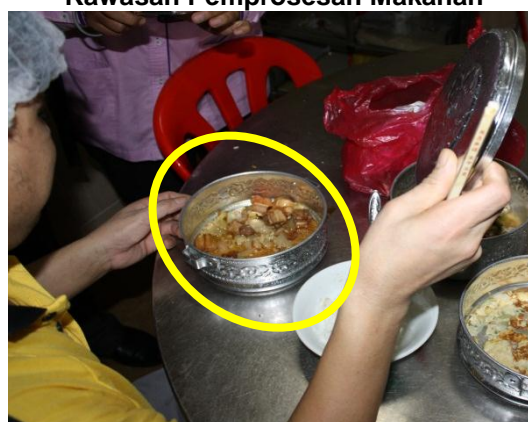
Gambar 1.16 Pekerja Membawa Makanan Tidak Halal Ke Kawasan Pemprosesan Makanan

Sumber: Jabatan Audit Negara Lokasi: Kilang Makanan Di Muar Tarikh: 2 Disember 2014