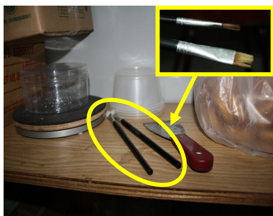
Gambar 1.15 Penggunaan Berus Bulu Babi

Lokasi: Kilang Makanan Di Batu Pahat Tarikh: 11 November 2014