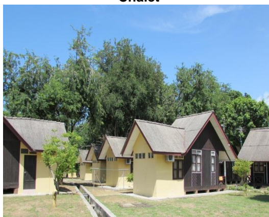
Gambar 2.22 Chalet

Lokasi: Tanjung Balau, Kota Tinggi Tarikh: 9 Disember 2014