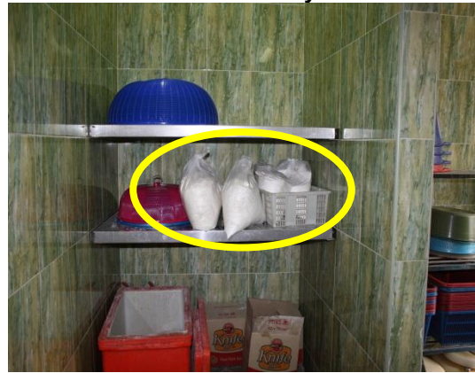
Gambar 1.18 Bahan Ramuan Dicampurkan Di Luar Dan Bahan Yang Digunakan Tidak Diketahui Status Halalnya

Lokasi: Kilang Makanan Di Muar Tarikh: 2 Disember 2014