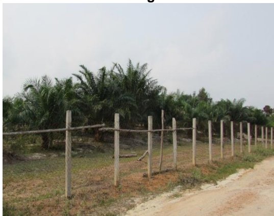
Gambar 2.3 Tanaman Kelapa Sawit Yang Berusia Lebih Kurang 7 Tahun

Lokasi: Mukim Pantai Timur, Pengerang Tarikh: 2 November 2014