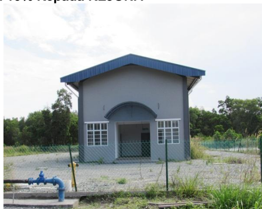
Lokasi: Lot PTB815, Bandar Tenggara Fasa 1 Tarikh: 9 Disember 2014