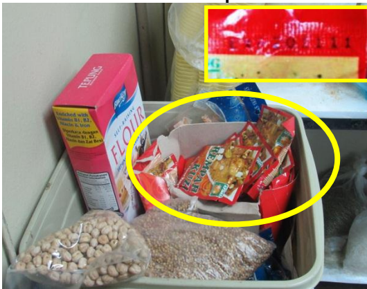
Gambar 1.11 Penggunaan Bahan Ramuan Yang Telah Tamat Tempoh

Lokasi: Hotel Di Mersing Tarikh: 24 November 2014