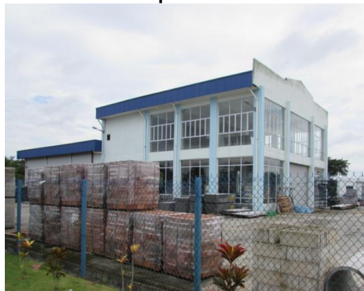
Gambar 2.9 Kilang Yang Beroperasi Di Atas Tanah Kerajaan Negeri Setelah Membuat Bayaran 10% Kepada KEJORA

Lokasi: Lot PTB267, Bandar Tenggara Fasa 1 Tarikh: 9 Disember 2014