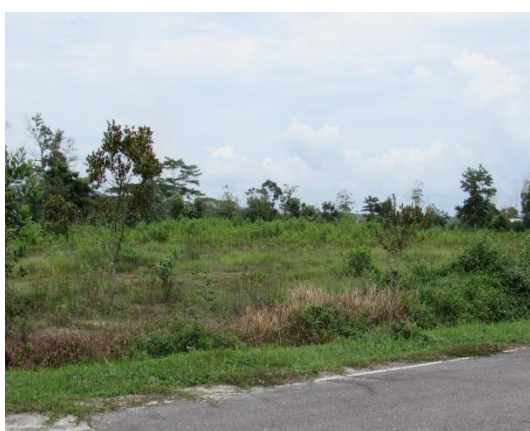
Gambar 2.18 Lot Tanah Yang Tidak Dibangunkan Dan Diluluskan Kepada SSI

Lokasi: Lot 1270, Bandar Tenggara Fasa 2 Tarikh: 8 Disember 2014