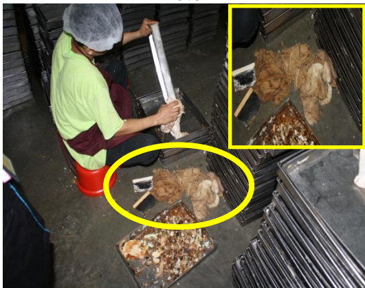
Gambar 1.5 Kain Lap Diletakkan Di Atas Lantai Dan Kotor

Lokasi: Kilang Roti Di Muar Tarikh: 1 Disember 2014