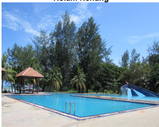
Gambar 2.19 Kolam Renang

Lokasi: Tanjung Balau, Kota Tinggi Tarikh: 9 Disember 2014