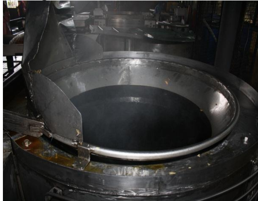
Gambar 1.9 Penggunaan Minyak Masak Yang Tidak Diganti Dan Telah Bertukar Warna

Lokasi: Kilang Makanan Di Batu Pahat Tarikh: 10 November 2014