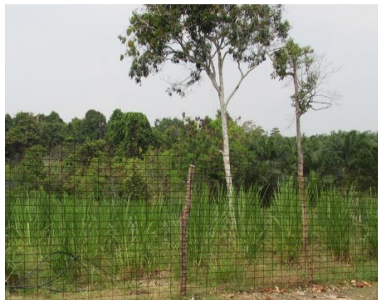
Gambar 2.4 Tanaman Kontan Diusahakan Oleh Pemohon Asal

Lokasi: Mukim Pantai Timur, Pengerang Tarikh: 2 November 2014