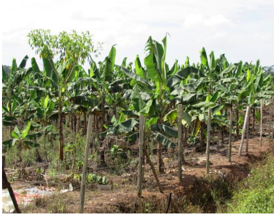
Gambar 2.7 Tanaman Kontan Diusahakan Sebelum Kelulusan Pemberimilikan

Lokasi: Desa Baru Nitar, Mersing Tarikh: 13 November 2014