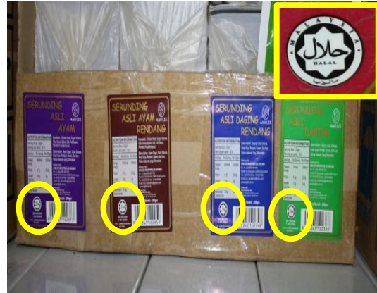
Lokasi: Premis Makanan Di Muar Tarikh: 2 Disember 2014