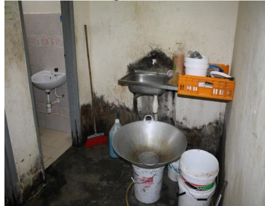
Gambar 1.4 Peralatan Memasak Diletakkan Berdekatan Dengan Tandas

Lokasi: Kilang Roti Di Muar Tarikh: 1 Disember 2014