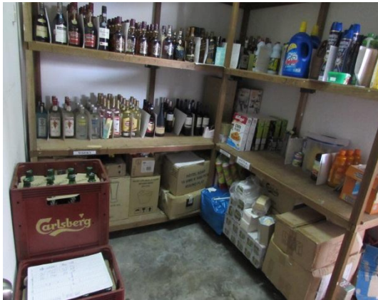
Gambar 1.17 Penyimpanan Minuman Keras Bersama Produk Makanan Lain

Lokasi: Hotel Di Mersing Tarikh: 24 November 2014