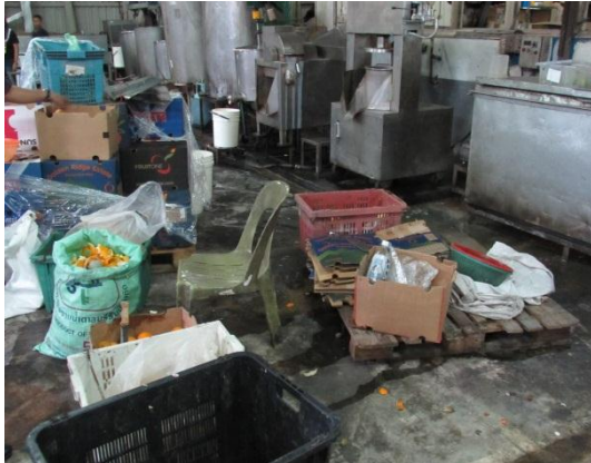
Gambar 1.3 Kebersihan Tempat Pemprosesan Kurang Memuaskan

Lokasi: Kilang Makanan Di Johor Bahru Tarikh: 25 November 2014