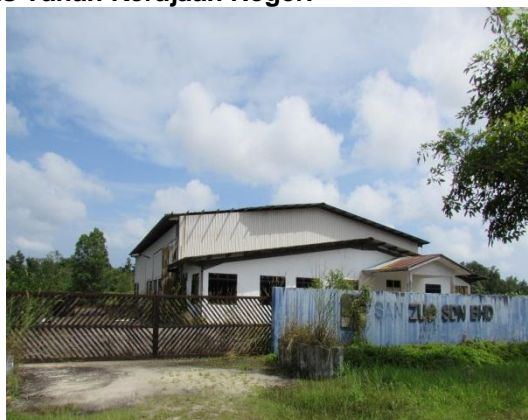
Lokasi: Lot PTB1479, Bandar Penawar Fasa 2 Tarikh: 9 Disember 2014