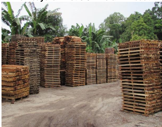
Gambar 2.1 Tanah Telah Diusahakan Dengan Industri Membuat Kayu Bergergaji Walaupun Pembayaran Notis 5A Belum Dibuat

Lokasi: Sg. Sedili Tarikh: 11 Januari 2015