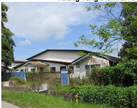
Lokasi: Lot PTB1481, Bandar Penawar Fasa 2 Tarikh: 9 Disember 2014