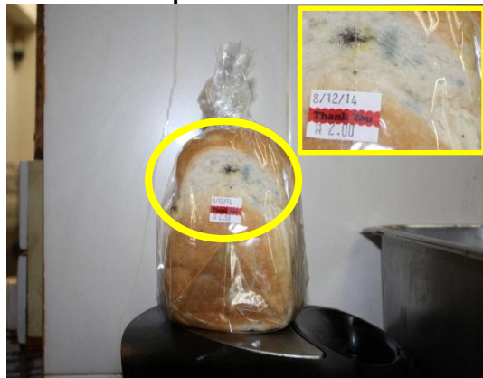
Gambar 1.12 Penggunaan Roti Yang Telah Tamat Tempoh Dan Berkulat

Lokasi: Premis Makanan Di Kluang Tarikh: 9 Disember 2014