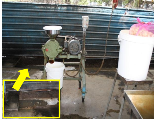
Gambar 1.2 Tempat Pemprosesan Makanan Berdekatan Longkang Terbuka

Sumber: Jabatan Audit Negara Lokasi: Kilang Makanan Di Muar Tarikh: 2 Disember 2014