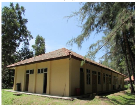
Gambar 2.23 Dewan

Lokasi: Tanjung Balau, Kota Tinggi Tarikh: 9 Disember 2014