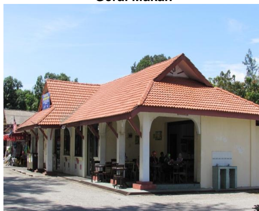
Gambar 2.20 Gerai Makan

Lokasi: Tanjung Balau, Kota Tinggi Tarikh: 9 Disember 2014