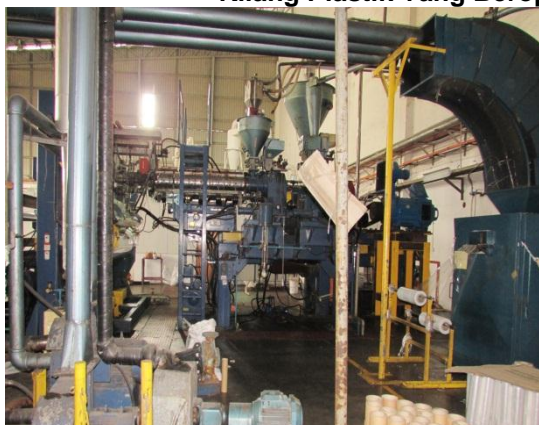
Gambar 2.16 Kilang Plastik Yang Beroperasi Di Atas Tanah Milik SSI

Lokasi: Lot 1270, Bandar Tenggara Fasa 2 Tarikh: 8 Disember 2014